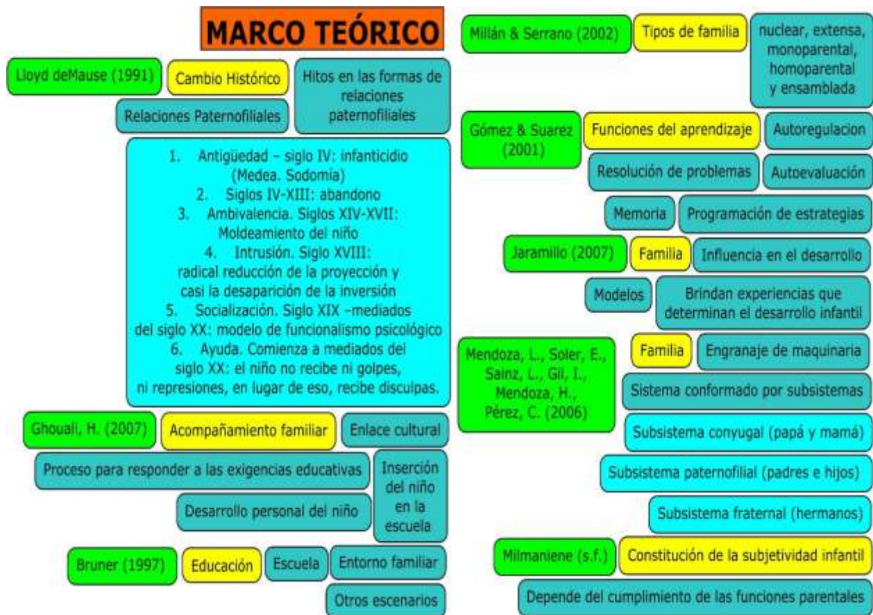
Ilustración 1. Desarrollo del Marco Teórico