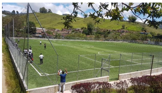
Figura 4. Sesión EFRyD Grado 7°