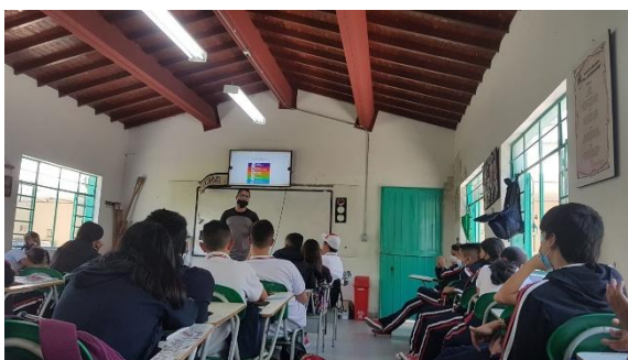
Figura 3. Sesión EFRyD Grado 7°

desarrollar habilidades sociales o habilidades para la vida como la empatía, las relaciones interpersonales, trabajo en equipo, el pensamiento crítico lo cual en primaria no se da porque cada niño realiza las actividades que desean.