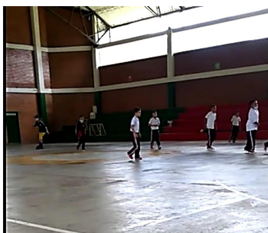
Figura 2. Sesión EFRyD Grado 5°

De la misma manera, se realizó observación a las sesiones de EFRyD del grado 7° de la misma institución Educativa, donde el docente que orienta el área es un Licenciado en EFRyD, con una experiencia de más de 18 años. Desde el comienzo de la clase se observa que es un docente idóneo y capacitado, pues llega con la indumentaria que identifica a estos docentes, en especial el silbato, el cual es fundamental en actividades prácticas o de campo, lo cual refiere a más del 90% de las sesiones.