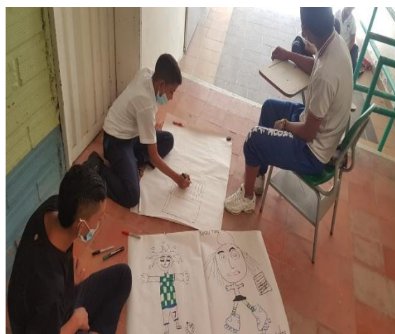
Figura 8. Desarrollo taller imaginario