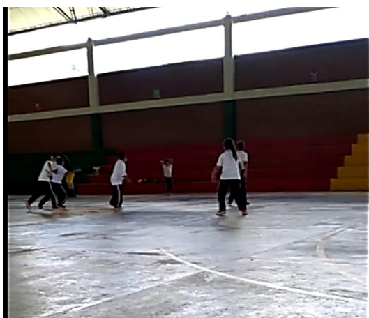
Figura 1. Sesión EFRyD Grado 5°

Una respuesta de un infante que deja mucho en que pensar, en especial a los docentes de EFRyR que tienen claro la importancia de una buena sesión en especial con niños, edad en la cual se deberían potencializar o desarrollar al máximo todas las habilidades motrices básicas, y a pesar de que el tiempo de educación física es corto, al menos para desarrollar nociones básicas en los niños de dichas habilidades.