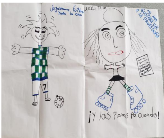
Figura 7. Resultado taller imaginario

o baloncesto pero que hiciéramos algo y nos hechaba planas para la casa o para hacerlas en clase y nadie se las hacia y simpre decía, y las planas pa cuando” (Pemberty, 2021). Lo anterior se evidencia en las figura 7 y 8.