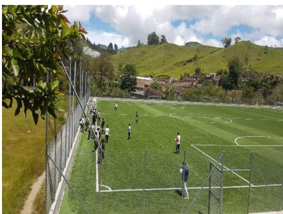
Figura 5. Sesión EFRyD Grado 7°