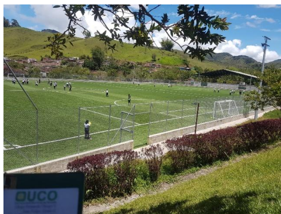
Figura 6. Sesión EFRyD Grado 7°

Al observar ambos tipos de clases nos lleva a ratificar la importancia de que cada persona se desempeñe en lo que es bueno o para lo que se capacito, ya que al hacer lo que no sabe hacer esta haciendo daño, el cual no se note a corto plazo pero que traerá consecuencia a