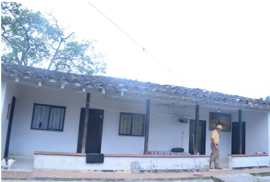
Casa de Gonzalo Marín