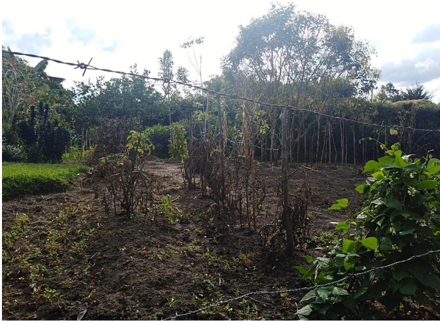
Cultivo agrícola, Leonel Raigosa