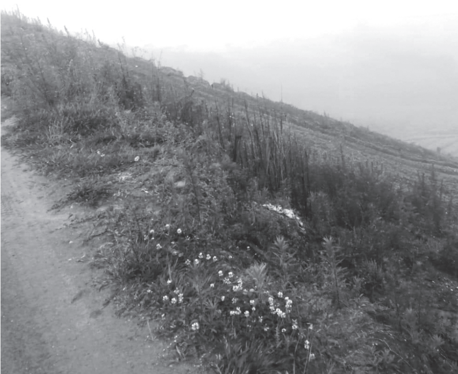
Abejorral (Antioquia, Colombia) Fuente: Alba Azucena López Giraldo (2024).