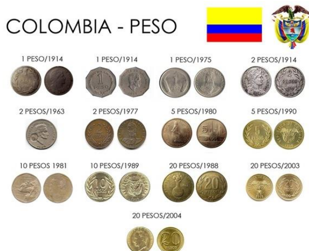
Imagen 3. Cambio de la moneda en el tiempo.