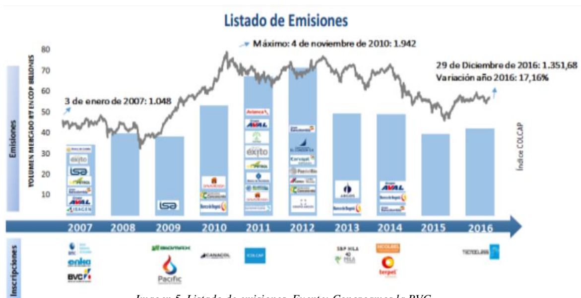
Imagen 5. Listado de emisiones.

En el 2019 se encuentran cotizando en la BVC aproximadamente 49 empresas. Las entidades económicas que requieren financiamiento para sus proyectos y que cotizan en bolsa son: empresas industriales, comerciales, de servicios, instituciones financieras y el Gobierno.