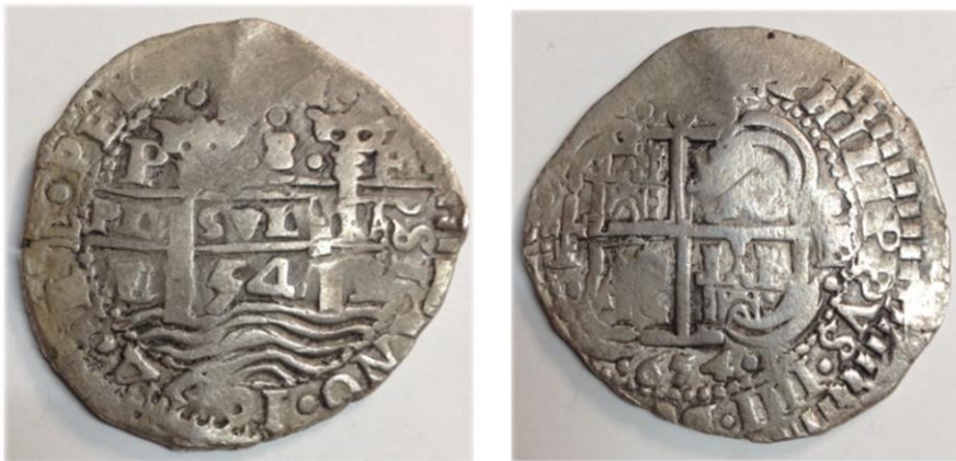
Imagen 2. Macuquina (Moneda) de 8 reales Felipe IV 1654.

Empiezan a aparecer monedas de diferentes denominaciones como las de 20 pesos, conocidas como “morrocotas de oro” y en 1657, se empiezan a fabricar piezas de plata como las macuquinas de 8 reales y en 1762 los patacones de cordoncillo.