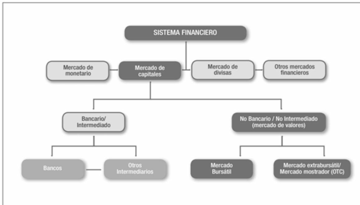
Imagen 1. Composición del Sistema Financiero Colombiano.

El sistema intermediado es un conjunto de instituciones que sirven como intermediarios entre usuarios que tienen exceso de liquidez y usuarios que requieren de liquidez para invertir o financiar sus empresas. Este sistema se divide en Bancos y otros intermediados. Los Bancos, que a su vez lo componen corporaciones financieras, cooperativas de ahorro y vivienda, compañías de financiamiento comercial, son instituciones que tienen como funciones otorgar a usuarios productos como créditos, CDTs, cuentas de ahorro, entre otros. Y los otros intermediados lo componen compañías aseguradoras, fondos de pensiones, sociedades de inversión inmobiliaria, fondos de inversión, entre otros 3 .