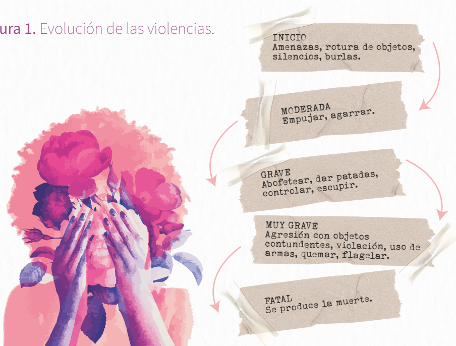
Figura 1. Evolución de las violencias.

Nota: Datos tomados de la Cartilla Fórmulas para la Igualdad N° 5 - Fundación Mujeres – Ángeles Álvarez – Guía de Mujeres.